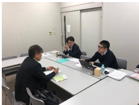
岡山リサーチパークインキュベーションセンターにて定期的な相談会の様子

岡山テックプランターにエントリーしたチームには、株式会社リバネスのサイエンスブリッジコミュニケーター®と中国銀行が、技術面や金融面からサポートを行います。